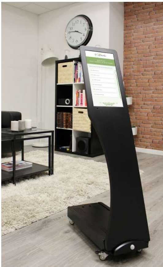
Pupitre tactile 15,6 pouces