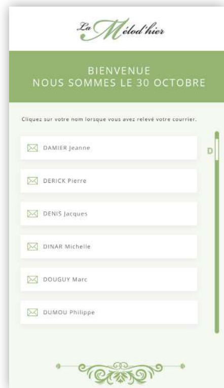
Front office pour les visiteurs

Modification message d'accueil, ajout ou suppression du courrier et des résidents, système de filtrage par ordre alphabétique.