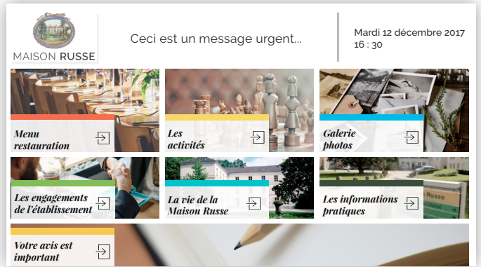
Accédez aux menus, activités, galerie...