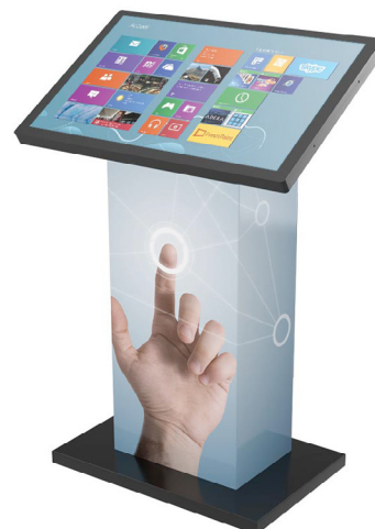
Borne tactile Kiosk M

Pour rendre disponible l'application, La Maison Russe a fait le choix d'une borne tactile Kiosk M installée dans son hall d'accueil. Elle s'est harmonieusement intégrée au sein de celui-ci en prenant soin de respecter toutes les normes en vigueur et notamment PMR. De par sa facilité d'utilisation et la puissance de ses composants, notre borne est destinée à un public hétérogène (visiteurs, résidents, corps médical) et est disponible à toute heure de la journée. La Maison Russe a ainsi fait le choix d'un mobilier interactif innovant dont la prise en main est immédiate pour animer et dynamiser son accueil.