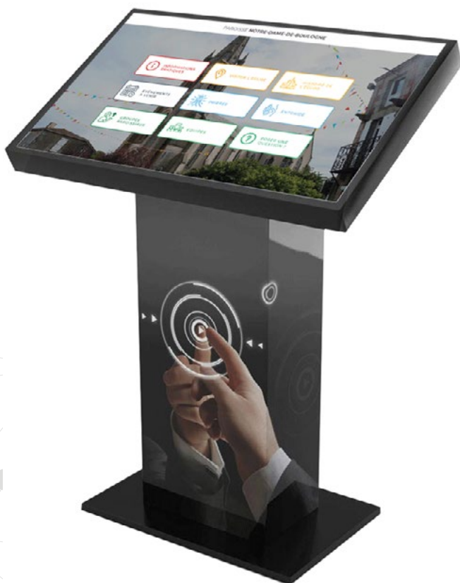
Totem tactile KIOSK S 32 pouces

La borne interactive a été paramétrée pour s'allumer et s'éteindre automatiquement aux heures d'ouverture et de fermeture de l'église. Chaque jour elle s'auto-gère afin de renseigner les visiteurs sans le moindre branchement ou action manuelle.