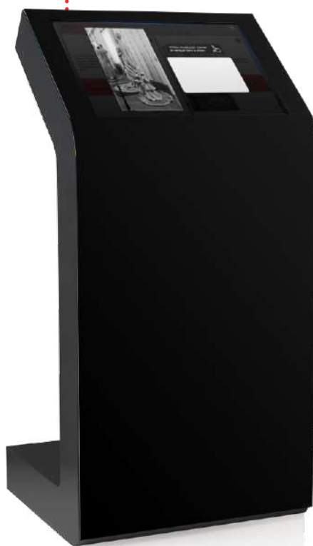
Borne tactile S22