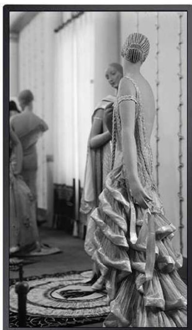
Écran d'affichage dynamique

Le personnel du musée a été pleinement satisfait de l'installation. Les visiteurs sont également sous le charme de l'utilisation des dispositifs puisqu'ils sont plusieurs dizaines à les utiliser chaque jour et à développer leurs connaissances de l'art par ce biais.