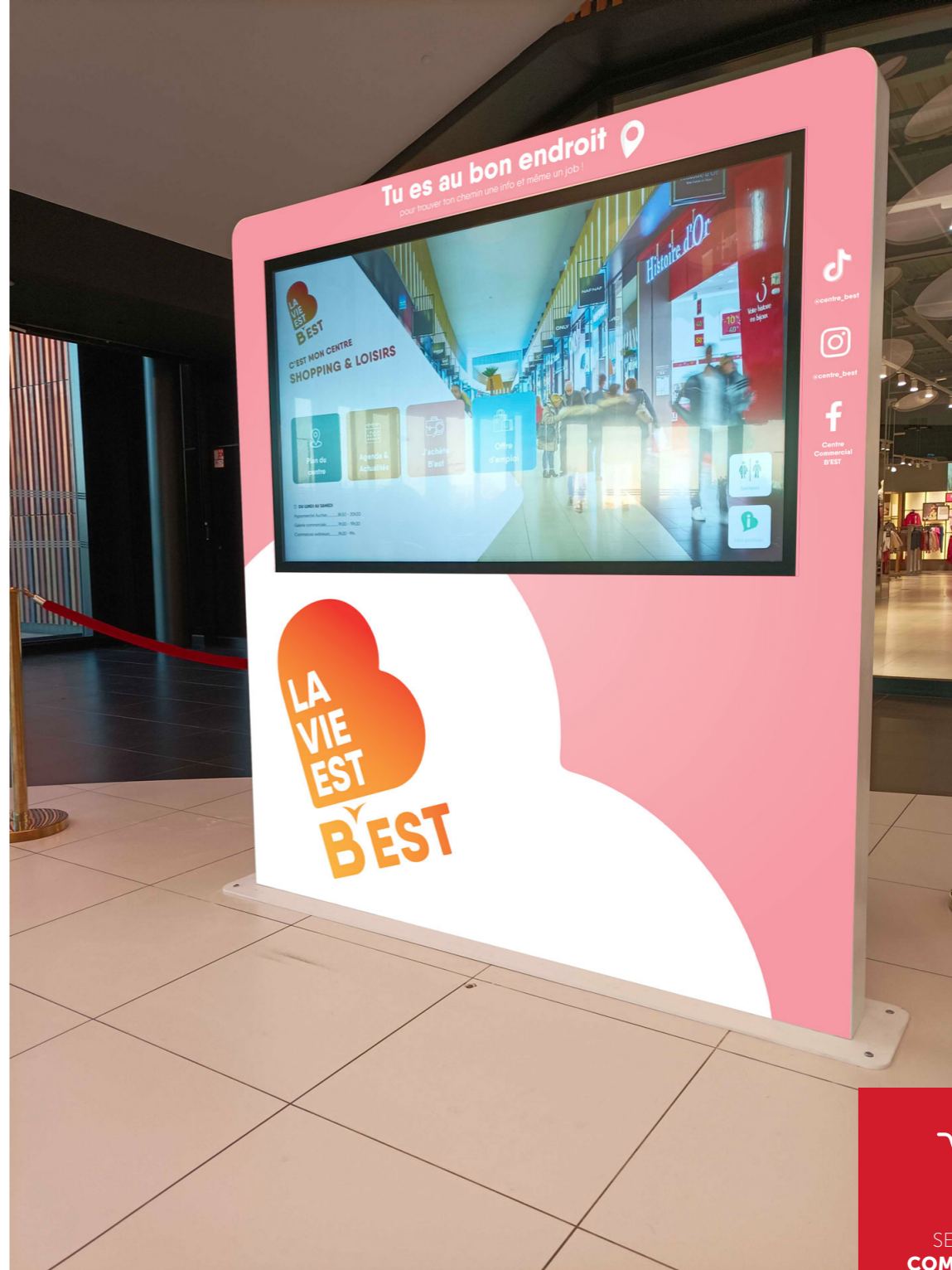
ÉTUDE DE CAS - CENTRE COMMERCIAL B'EST

3 Apporter une réponse aux visiteurs de manière ludique et autonome